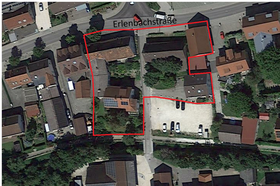
Abb.: „Schuler/Schwer/Laupheimer-Areal“ (rot=Umgriff) an der Erlenbachstraße ggü. des Rathauses

Sämtliche Gebäude des Messerschmidt-Areals wurden am 19.7.2018 von außen mit dem Fernglas voruntersucht und die Gebäude innen (insbesondere die Dachstühle) begangen. Hierbei wurden keine Brutvögel oder Fledermausquartiere im oder an den Gebäuden festgestellt. Relevante Gehölze waren in diesem Areal nicht vorhanden.