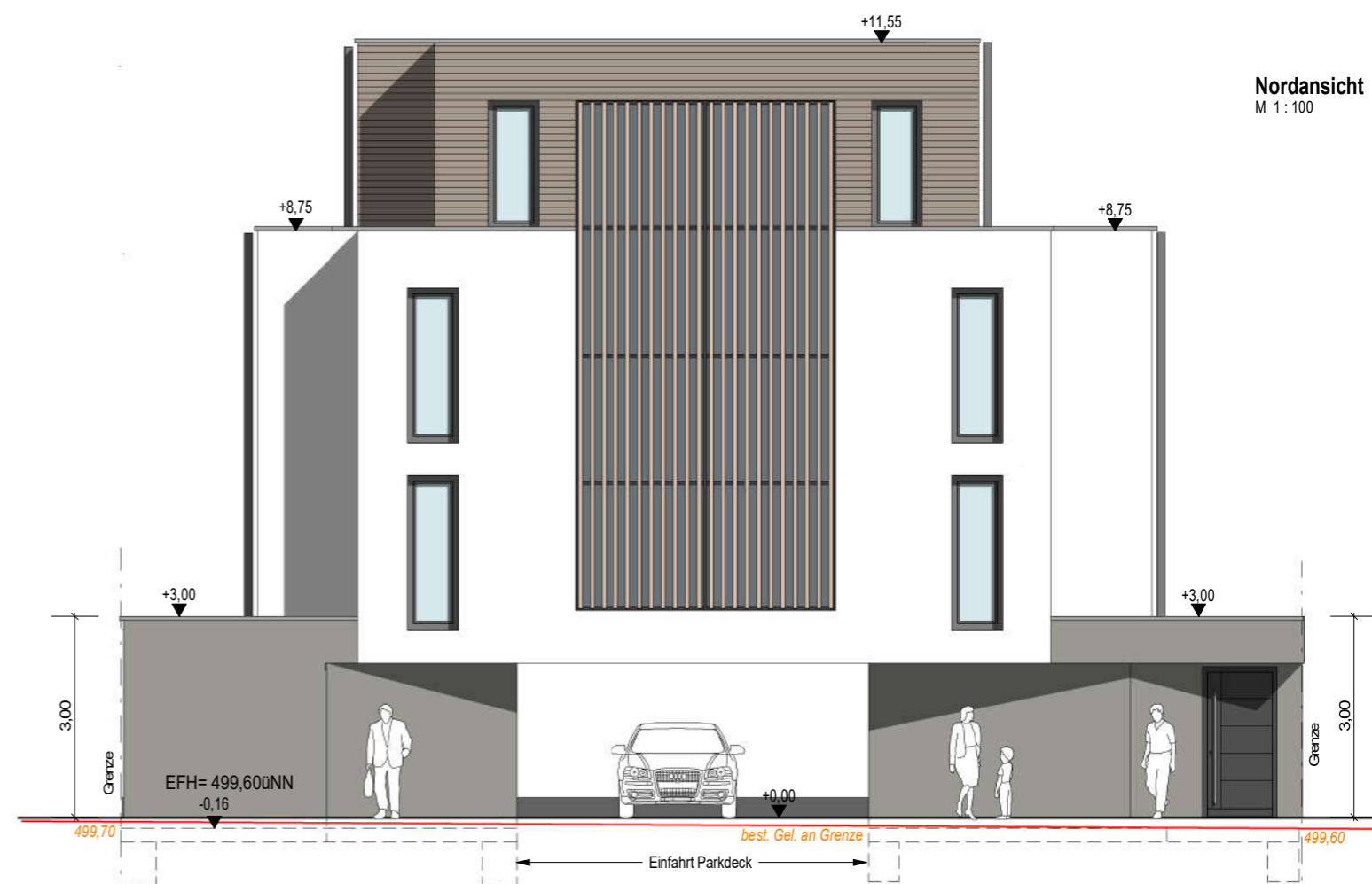
Nordansicht M 1 : 100