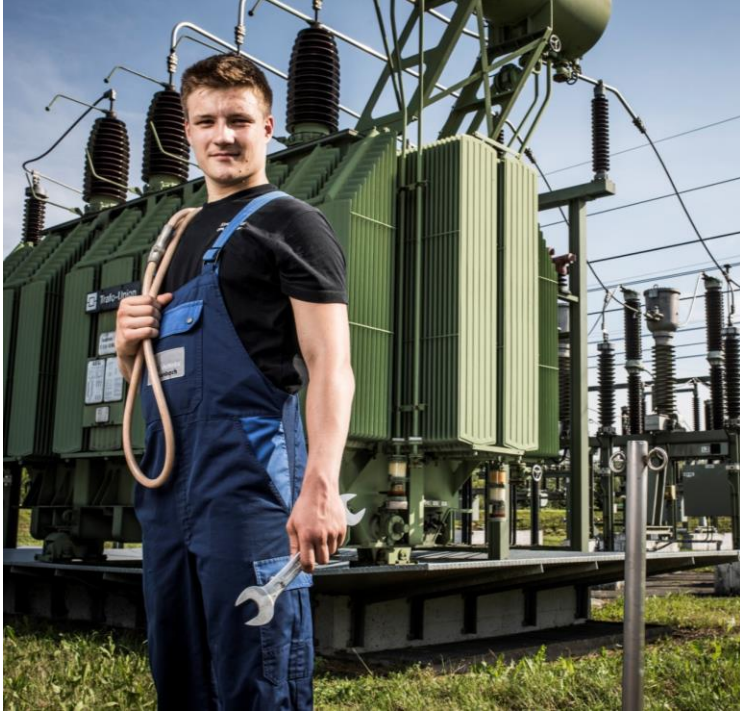
Strom- und Gasnetze