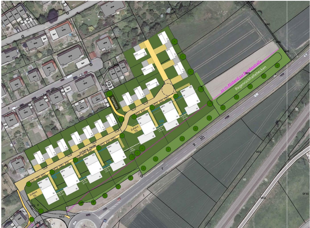
Städtebaulicher Entwurf als Grundlage des Bebauungsplans

Als Grundlage für die städtebauliche Entwicklung des Plangebietes dient der Entwurf des Büros Stenshorn Kopp Architekten und Stadtplaner PartGmbB aus Ulm.