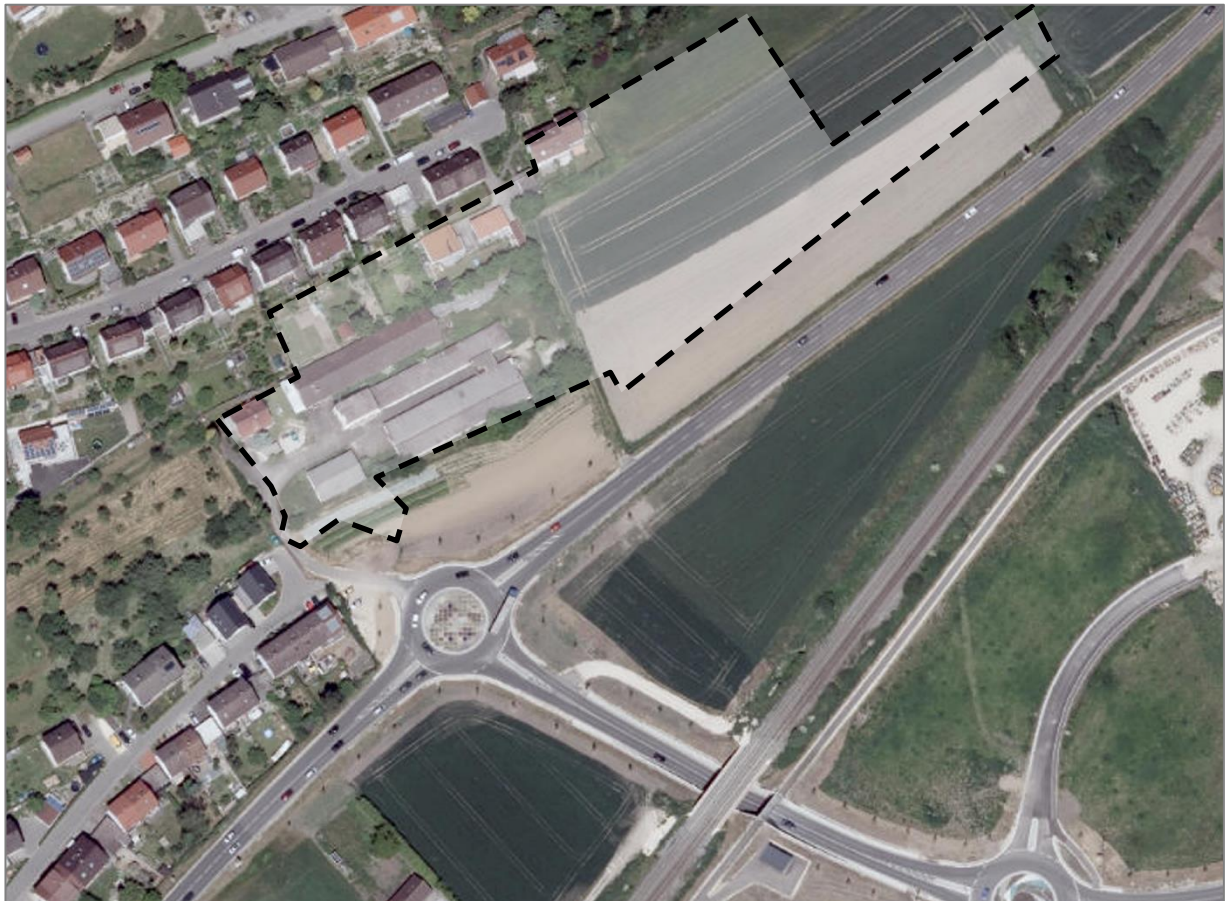
Luftbild mit Umgriff des Plangebietes