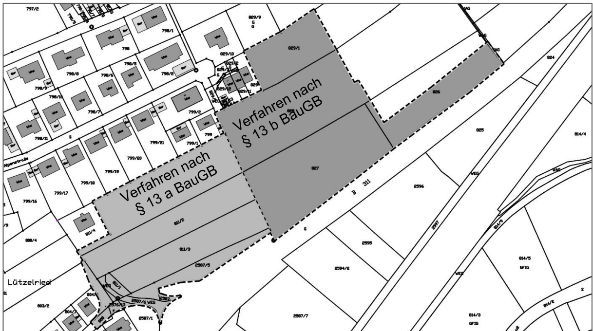
Geltungsbereich des Bebauungsplans mit Flächendarstellung des § 13a- und § 13b- Verfahrens

Auf die Durchführung einer formalen Umweltprüfung gemäß § 2 Abs. 4 BauGB wird verzichtet. Entsprechend ist weder die Ausarbeitung eines Umweltberichts gemäß § 2a Abs. 2 BauGB noch ein naturschutzrechtlicher Ausgleich im Sinne des § 1a Abs. 3 BauGB erforderlich.